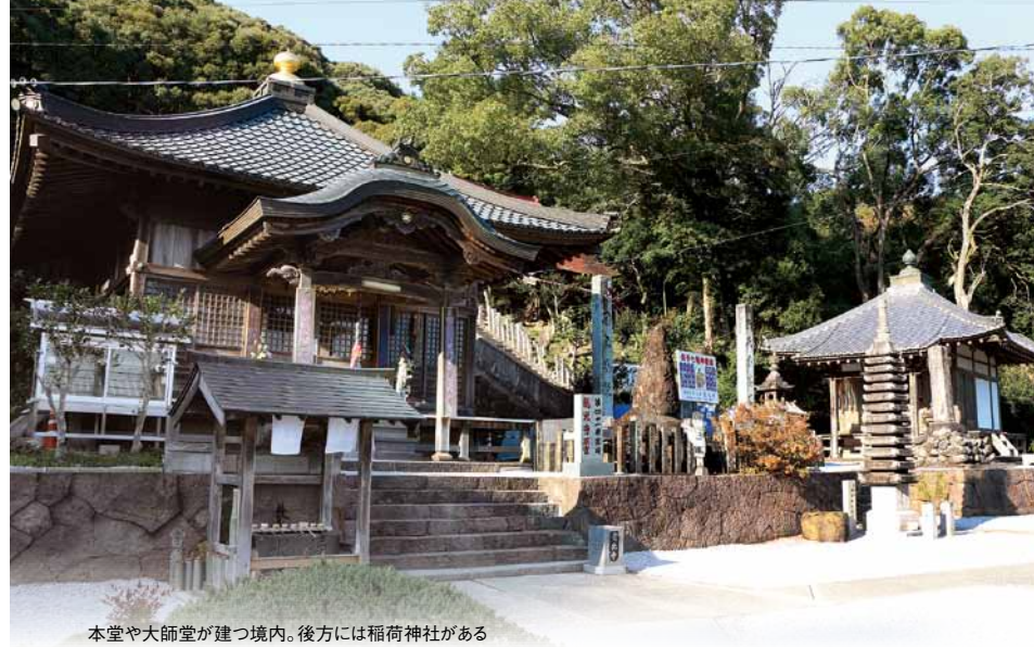
本堂や大師堂が建つ境内。後方には稲荷神社がある

ここには霊場によく見られる仁王門はなく、石の鳥居が山門となっている。初めて訪れた人の中には「ここはお寺?」と不思議に思う人も少なくない。石の鳥居をくぐると、遠く視線の先には本堂や大師堂へと導く階段と稲荷神社の赤い鳥居が見える。参道沿いには和菓子や柑橘類などを売る店がある。