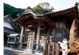
神仏分離令で明治時代に建てられた本堂

境内からはさらに石段が延び、その先にはひときわ目を引く赤い鳥居が建っている。この赤い鳥居は稲荷神社のもので、そこから石段を40段ほど上がったところに、緑に抱かれた稲荷神社の社殿がある。