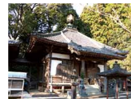
屋根の上に金色の宝珠が施された本堂

仁王門をくぐり石段を上ると、右側には珍しい茅葺き屋根の鐘楼がある。納経所は左側の石段を上ったところにあり、その奥に本堂と大師堂が並ぶ。本堂は、享保13年(1728)に吉田藩主・伊達若狭守によって建立されたと伝えられている。本堂の大日如来坐像、大師堂の弘法大師坐像ともに県指定文化財。弘法大師坐像は、檜の寄木造りで、正和4年(1315)の銘が入っており、胎内銘入りの弘法大師像としては日本最古ではないかといわれている。「南予七福神」の一寺でもあり、境内には七福神の石像が祀られている。