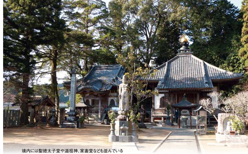
境内には聖徳太子堂や道祖神、家畜堂なども並んでいる

仏木寺の境内でひときわ目を引くのが茅葺き屋根の鐘楼。これは四国霊場のなかでここだけという珍しいものだ。元禄年間(1688～1704)に再建されたといわれており、300年以上もの歴史を誇っている。のどかな山里の景色と茅葺き屋根の風情が相まって実に情緒豊かだ。屋根は幾度も葺き替えられている。