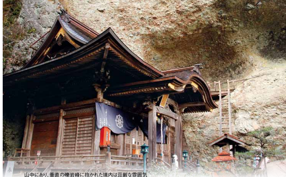
山中にあり、垂直の礫岩峰に抱かれた境内は荘厳な雰囲気

大師堂奥の仁王門から狭い山道を300mほど上ると、かつての弘法大師の修行の場・遍割禅定がある。入り口には木製の扉があり、危険を伴うため普段は鍵が掛かっている。そそり立つ大岩の裂け目を抜け、鎖を頼りに約10m岩山を上る。さらに21段のはしごを上れば、岩の頂上に祀られた白山権現にたどり着く。