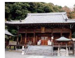
境内を一段上がったところに建つ本堂

境内の周辺は、景観樹林保護地域に指定された美しい自然の宝庫。境内からの眺望もよく、松山市街はもとより、天気の良い日には瀬戸内海まで見渡すことができる。