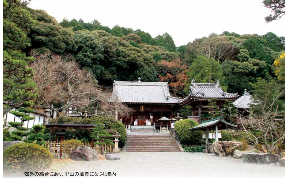
郊外の高台にあり、里山の風景になじむ境内

天和年間(1681～1684)、名僧・龍瑚が住職となる。徳川家の帰依を受けることになり、寺運は大いに栄えた。この時に、第四代将軍家綱の念持仏三体の一つである歓喜天を祀った。本堂に向かって左にある歓喜天堂は、平成18年(2006)に再建されたもの。厄除けや商売繁盛、合格祈願に多くの人が訪れる。