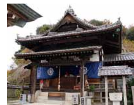
境内の左端にある本堂。目の前に地藏車がある

宿坊の前にある大師堂は、昭和60年(1985)に建立された比較的新しい建物。そばには金剛杖を持ち、菅笠をかぶった大師像がたち、訪れたお遍路さんを見守っている。鐘楼、通夜堂、納経所も趣のある佇まいだ。鐘楼は、明治14年(1881)、今治城内にあった太鼓楼の古材で再建されたといわれており、四国霊場と今治城の縁の深さが感じられる。