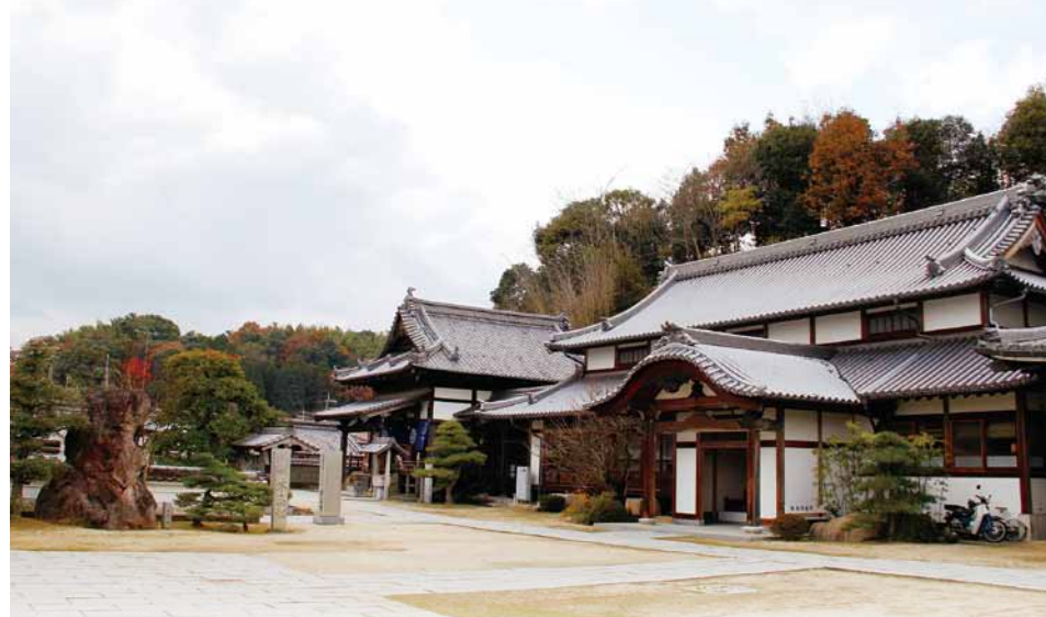
もとは金輪山の山頂にあった泰山寺

大師堂のそばにあった不忘松は、弘法大師が一寺を建立した際に御手植えされたという松の木。一度枯れてしまい、今は古い切り株が残っている。この切り株は腰痛に霊験あらたかだといわれている。その横には子株として育てていた4株のうちの1株が植えられている。小さいながらも見事な枝ぶりだ