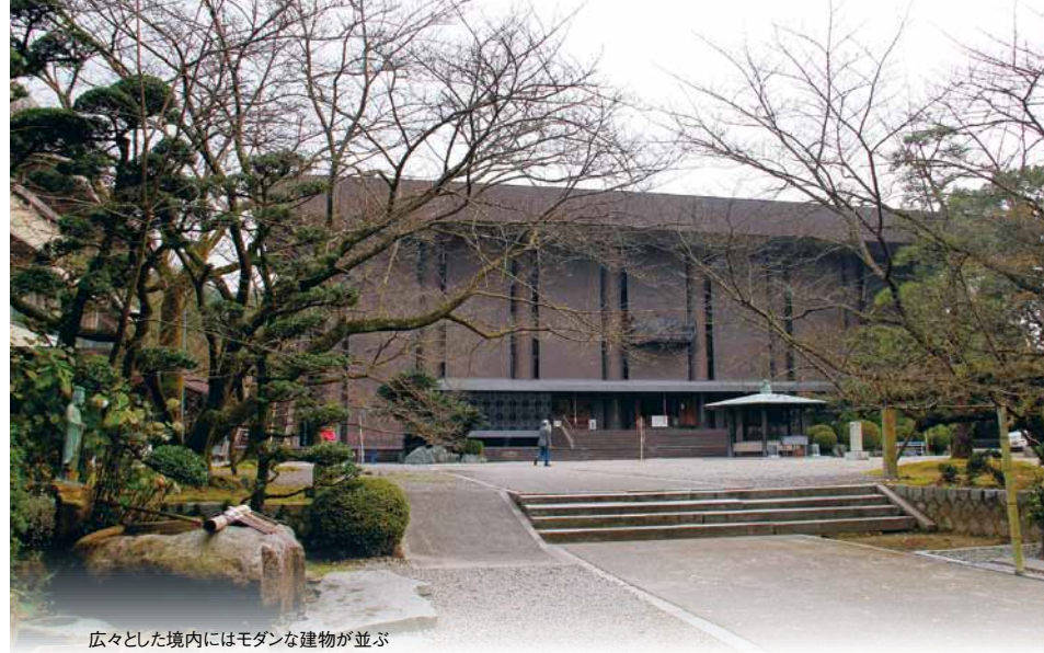
広々とした境内にはモダンな建物が並ぶ

安産祈願所として知られる香園寺。門前で苦しんでいる身重の婦人を見つけた大師が、梅檀の香を焚いて加持祈禱をすると、婦人は元気な男子を無事に産出したという伝説が残っている。背中にゴザを背負い、右手に錫杖を持ち、左手に赤ちゃんを抱いた子安大師像は、子を想うやさしさに溢れている。